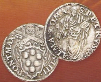
Le monete di Pio IV, "l'altro" Medici