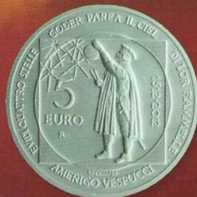
L'argento del Titano brilla per Vespucci e Sassu