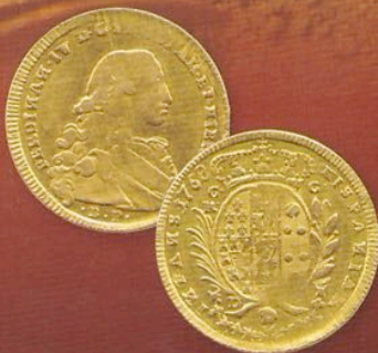
Un inedito 6 ducati di Ferdinando IV