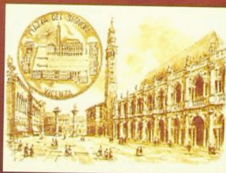
Mostre, premi e novità a Vicenza Numismatica